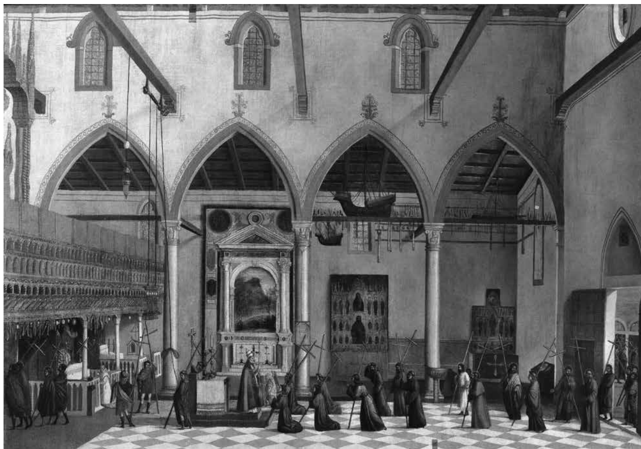
2. Vittore Carpaccio, Ukazivanje raspela na brdu Araratu u crkvi sv. Antuna u Castellu , 1512.–1513., Venecija, Gallerie dell'Accademia, Archivio fotografico del Polo Museale del Veneto (uz dozvolu Ministero dei beni e delle attività culturali e del turismo; zabranjeno daljnje reproduciranje) / Vittore Carpaccio, The Apparition of the Crucifixes of Mount Ararat in Sant'Antonio di Castello , 1512–1513, Venice, Gallerie dell'Accademia, Archivio fotografico del Polo Museale del Veneto (reproduced with permission of the Ministero dei beni e delle attività culturali e del turismo, further reproduction prohibited)

altari super transversam trabeam ). 16 Godine 1746. u djelu Monumenta historica provinciae Rhagusinae Ordinis minorum Sebastijan Slade Dolci ukratko opisuje čudo također se služeći njegovom službenom verzijom predstavljenom u procesu beatifikacije. 17 Gaspare da Monte Santo 1804. objavljuje djelo Gesta dell'apostolo san Giacomo della Marca anconetana u kojem dodaje pojedinosti koje se ne nalaze u ranijim izvorima. Navodi kako je Jakov prilikom postavljanja anđela posebno upozorio da se moraju štititi od vatre. 18 U odnosu na službeni tekst, autor pojašnjava čudotvornu radnju anđela koji su pomicali kadionice prema raspelu. 19