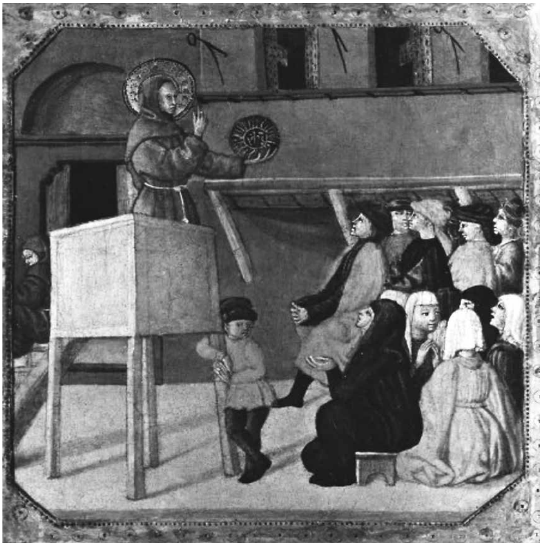
4. Giovanni di Ser Giovanni, Propovijed sv. Bernardina Sijenskog , sredina 15. stoljeća, Bologna, Fondazione Federico Zeri, Università di Bologna (uz dozvolu Fondacije; zabranjeno daljnje reproduciranje) / Giovanni di Ser Giovanni, Sermon of Saint Bernardino of Siena, mid-15 th century, Bologna, Fondazione Federico Zeri, Università di Bologna (reproduced with permission of the Foundation, further reproduction prohibited)

u Dubrovnik prije početka korizmenih propovijedi 1433. godine. 37 Jakov se odazvao na poziv, ali zbog obaveza u Italiji nije mogao ostati propovijedati. Na vlastiti zahtjev zamijenio ga je Ludovik da Strassoldo, također istaknuti franjevac i pobornik opservantskog pokreta koji je, osim što je propovijedao, i upravljao samostanom naredne godine. 38 Krajem 1434. Jakov se vratio u Dubrovnik. Zadovoljstvo njegovom prisutnošću tada je bilo manje jer je dosljedno provodio pravila franjevačke opservancije. Iz samostana Male braće istjerao je tri člana Bosanske provincije odana starim pravilima Reda, a istom je prilikom zabranio prihvaćanje putujućih franjevaca iz Bosne u dubrovačkim samostanima što je izazvalo neslaganje gradske vlasti. 39 Sljedeći