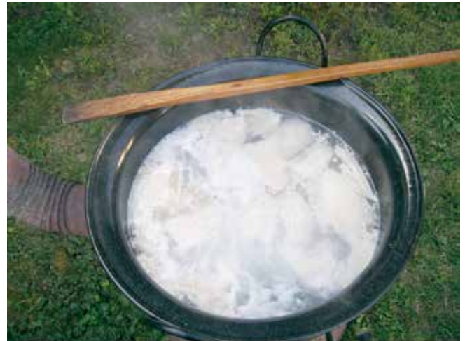
Slika 2. Kuhanje komada leđne slanine