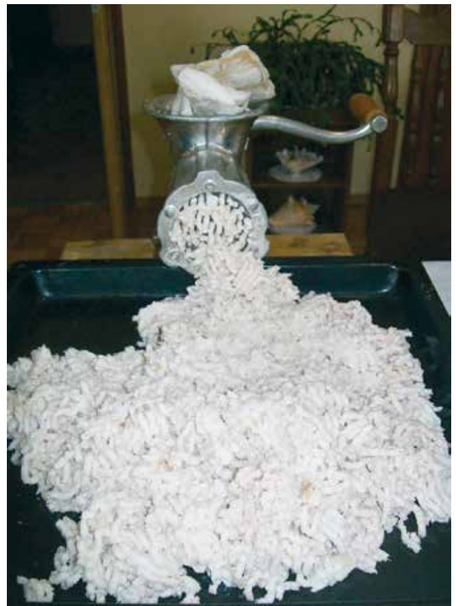
Slika 3. Usitnjavanje masti u stroju za mljevenje