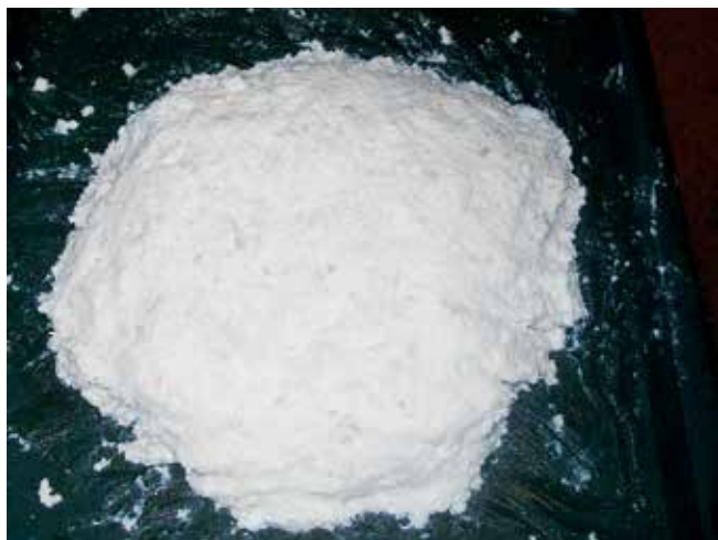
Slika 4. Kosana mast