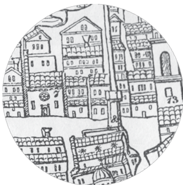
3. Općinske kuće zapadno od Sponze, detalj crteža prema reljefnom prikazu grada Dubrovnika u rukama sveca zaštitnika sredinom 15. stoljeća (prema M. Rešetar; br. 7 – crkva Petilovrijenci, 8 – Orlandov stup/standarac; 13 – Gradski zvonik), Dubrovnik, crkva sv. Vlaha / Communal houses west of Sponza, a detail of the drawing after the relief representing the town of Dubrovnik in the hands of St Blaise, its patron saint, from the mid-15th century (after M. Rešetar; N o 7 – The church of Petilovrijenci; N o 8 – The Orlando statue; N o 13 – municipal belfry), Dubrovnik, Church of St Blaise

govu inicijativu i spremnost na investiranje – zasluge za trijem pred prvim blokom ne mogu, dakako, pripisati Gallibertiju. Da su okolnosti to dopustile, u konačnici bi jamačno svih šest blokova općinskih kuća između Sponze i Petilovrijenaca dobilo kamene trijemove. 40 Oni su međutim, kako pokazuje detalj vedute u Društvu prijatelja dubrovačke starine (sl. 4), bili izvedeni samo pred prvim i četvrtim blokom.