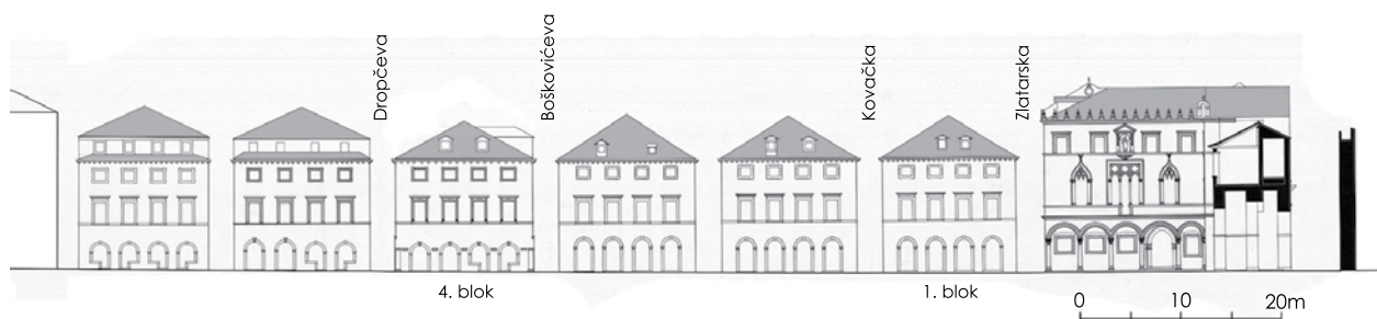
2. Građevine na istočnom dijelu sjevernog pročelja Place (arhitektonska snimka: Ivan Tenšek, Institut za povijest umjetnosti, 1970.; grafička obrada: Davor Zuljan) / Row of buildings along the east part of Dubrovnik' main street Placa (architectural recording: Ivan Tenšek, Institute of art history, Zagreb, 1970.; computer drawing by Davor Zuljan)

monoforama i velikog balkona pred triforom, oslonjenog na snažne, klesanim reljefima ukrašene dvostruke konzole. 27