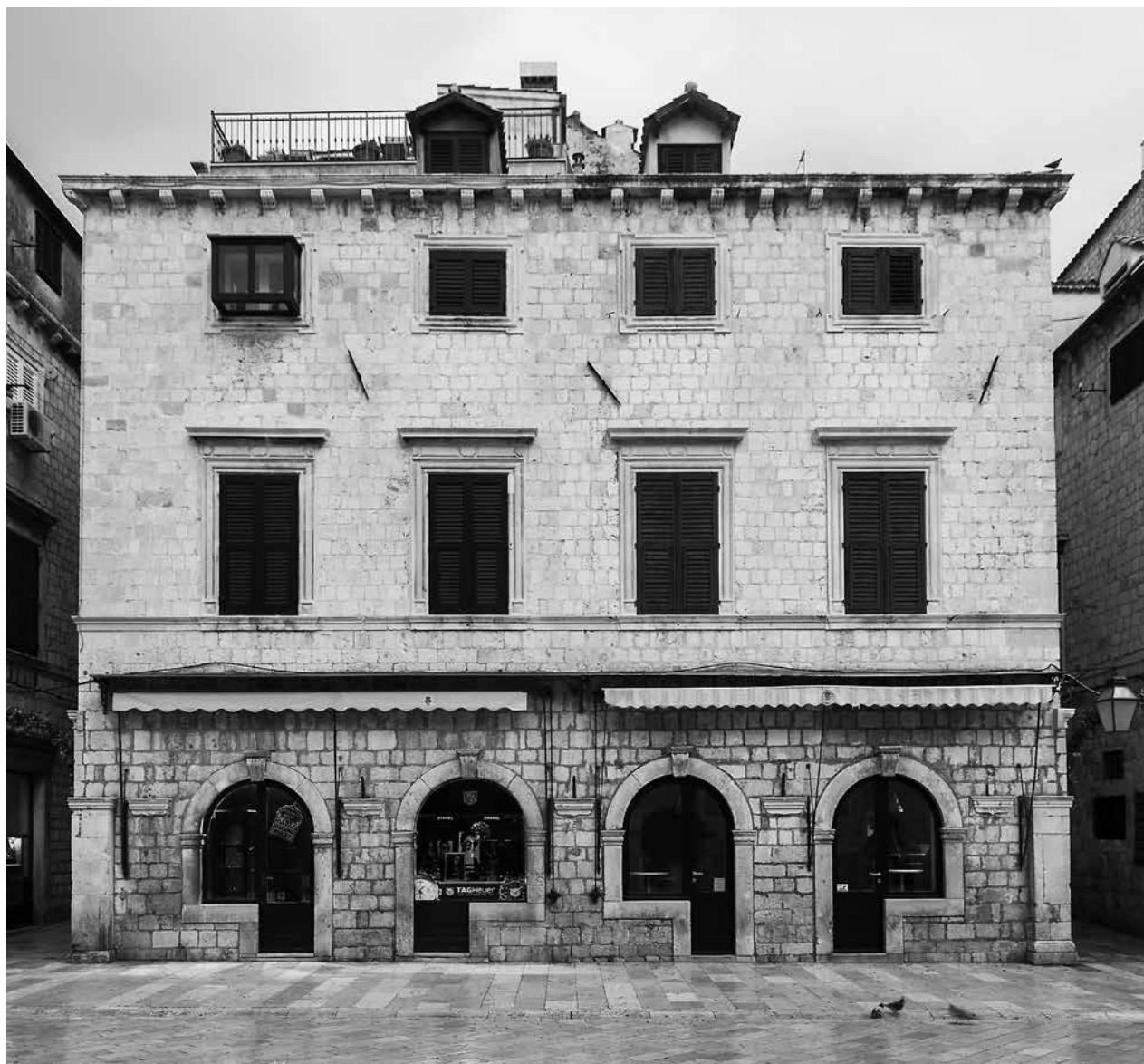
6. Pročelje četvrtog bloka općinskih kuća / The facade of the fourth block of communal houses

četiri stupa!), prvi i četvrti blok razlikuju se od ostalih upravo, unatoč stupnju stilizacije prikaza neupitnim, formatima, odnosno proporcijama prozora gornjih etaža.