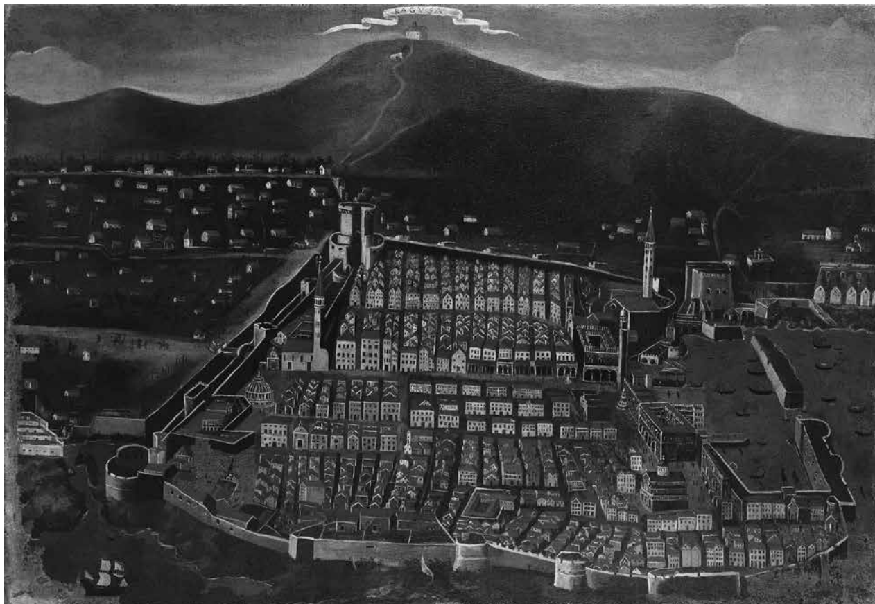
1. Veduta Dubrovnika prije potresa 1667., Društvo prijatelja dubrovačke starine, Dubrovnik / Veduta of Dubrovnik before the earthquake of 1667, Društvo prijatelja dubrovačke starine [Society of the Friends of Ancient and Historical Dubrovnik]