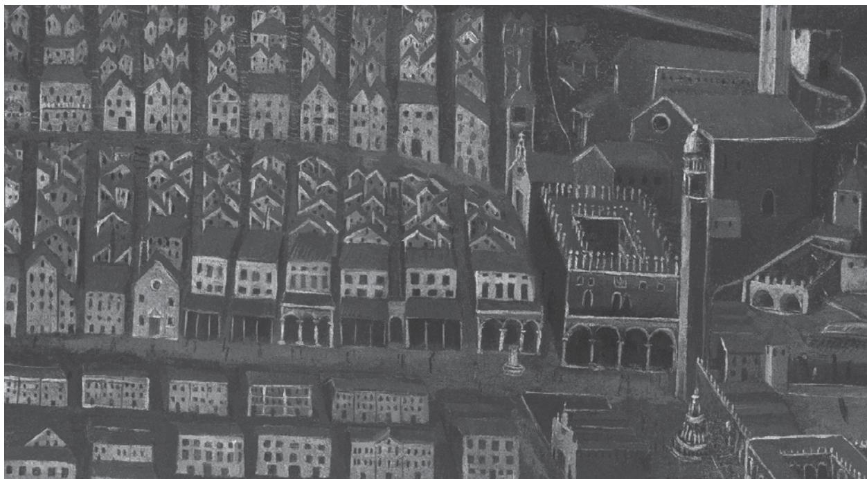
4. Građevine na istočnom dijelu sjevernog pročelja Place, između crkve Petilovrijenci i Sponze, na veduti Dubrovnika prije potresa 1667., Društvo prijatelja dubrovačke starine, Dubrovnik (foto: D. Vokić) / Row of buildings along the east part of Dubrovnik' main street Placa, veduta of Dubrovnik before the earthquake of 1667, Društvo prijatelja dubrovačke starine [Society of the Friends of Ancient and Historical Dubrovnik]

Uz četiri otvora vrata »na koljeno«, 42 na pročelju četvrtog bloka, u međuvremenu prezidanom, do danas su u zoni prizemlja sačuvani i tragovi trijema: udvojeni »dvovisinski« ugaoni pilastri s bazama i kapitelima, polustupovi na kojima su počivali bočni lukovi trijema te pet konzola na koje su bile oslonjene pete svodova trijema (sl. 5). Na njih su, kao na ostatke prijetresne izgradnje, upozorili još Cvito Fisković i Lukša Beritić. 43 Viši bočni pilastri pokazuju visinu završnog vijenca trijema, a niži pilastri i konzole na pročelju visinu kapitelne zone njegovih lukova. Treba primijetiti da je rješenje trijema na četvrtom bloku – s pilastrom koji prihvaća bočni luk – arhitektonski »čišće« nego na Sponzi gdje je bočni luk trijema oslonjen na konzolu naknadno umetnutu u brid