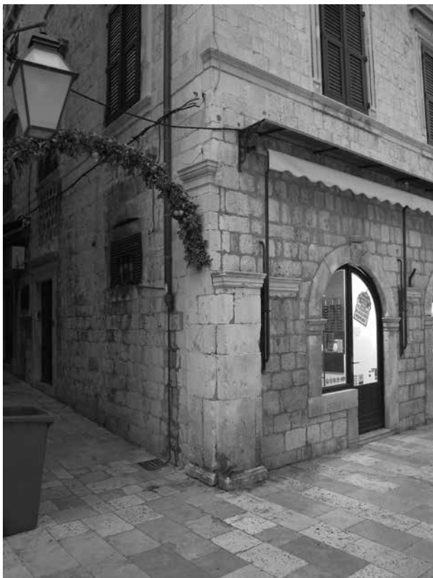
5. Ostaci konstrukcije trijema na pročelju četvrtog bloka općinskih kuća – udvojeni pilastri na jugozapadnom uglu i konzola svoda / Remains of the portico on the facade of the fourth block of communal houses – twin pilasters on southwest corner and the bracket of the vaulting

(starijega) pročelnog zida. Tri od spomenutih pet konzola svodova trijema četvrtog bloka postavljene su u osima zidnih polja između četiriju vrata dućana, a dvije “vanjske” u osima polja između vrata i pilastara uz bridove pročelja. Svod čija je konstrukcija, s obzirom na broj stupova, trebala imati četiri cijela kvadratna svodna polja i, uz ugaone pilastre, još tri konzole, na pročelju je, dakle, umjesto pet imao ukupno sedam oslonaca, a njegova tlocrtna projekcija nije bila posve pravilna. To je proizašlo iz nemogućnosti da se geometrija svoda u cijelosti uskladi s rasporedom otvora prizemlja. Vrata dućana nisu naime razmještena ravnomjerno po širini pročelja, jer bi to (zbog debljine bočnih zidova građevine) onemogućilo da prostor prizemlja bude podijeljen na četiri jednaka dijela, pregradnim zidovima koji su nosili i svodove u unutrašnjosti.