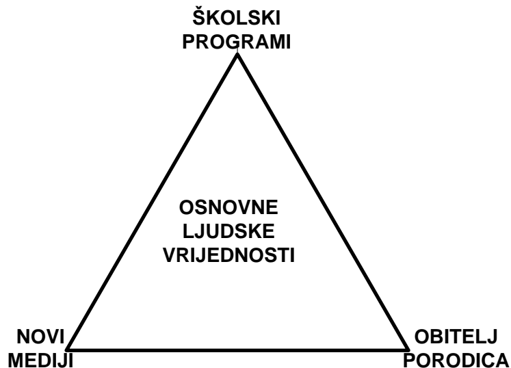
Slika 1: Pedagoški trokut i pedagoški trijalizam

Ovdje pokušavamo naučno razmatrati vezu osnovnih ljudskih vrijednosti te zamišljenog trokuta u kojem odrastaju djeca i mladi (škola – obitelj (porodica) – novi mediji), s naglasnom na analizu mogućnosti koje na planu demokratizacije odgoja i školovanja te stvaranja uvjeta za upoznavanje osnovnih ljudskih vrijednosti (npr. sloboda, mir, nenasilje, tolerancija...) nude novi komunikacijski mediji. Djeca i mladi su u tom pedagoško-socijalnom trokutu izložena različitim sustavima vrijednosti čije je utjecaje teško kontrolirati i predvidjeti. No, za početak je važno upozoriti na taj svojevrsni trijalizam čije ćemo efekte gledati i proživljavati u idućim godinama i decenijama.