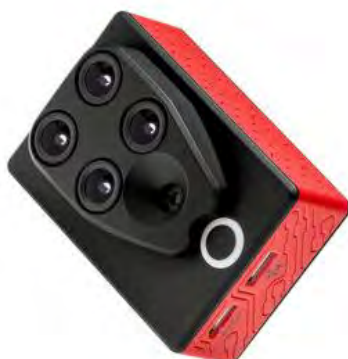
Slika 3. Multispektralna kamera Parrot Sequoia

Ovo je jedna od naprednijih multispektralnih kamera, a može se integrirati na većinu dronova. Snima u pet pojaseva (plavi, zeleni, crveni, crveni rubni i bliski infracrveni), a dobiveni se podatci mogu koristiti za analizu usjeva, kao i za donošenje odluka o vremenu žetve (COPTRZ, 2022.).