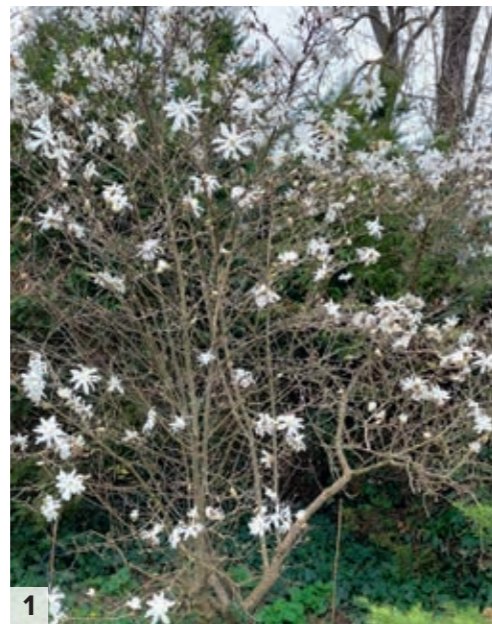
1) Rascvala magnolija 2) Sadnica Magnolia grandiflora u tegli u vrtnom centru

vrijeme kulturom tkiva u suvremenim laboratorijima). Postoji nekoliko prednosti uzgoja magnolija iz sjemena. Generativnim načinom razmnožavanja, kontroliranim i