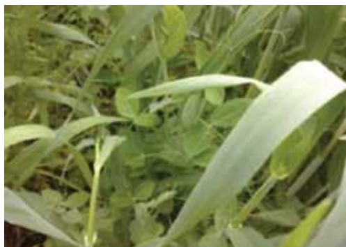
Slika 1. Smjesa stočnog graška i raži

Raž omogućuje dobru pokrovnost tla već u jesen dok ozima grahorica glavninu pokrovnosti ostvaruje u proljeće. U istraživanjima s ozimim pokrovnim usjevima u Istočnoj Hrvatskoj kojeg su proveli Brozović i sur. (2014), početni razvoj smjesa stočnog graška s raži i pšenicom (Slika 1. i 2.) bio je brži u odnosu na stočni grašak. Smjesa stočnog graška s raži ostvarila je 70% veći sklop i brži početni razvoj u odnosu na stočni grašak (Slika 3.) kao samostalan usjev. U istom istraživanju raž, grahorica i njihova smjesa (Slika 4.) pokazali su se najučinkovitiji u pokrivanju tla formiranjem najveće biomase (Brozović i sur, 2020).