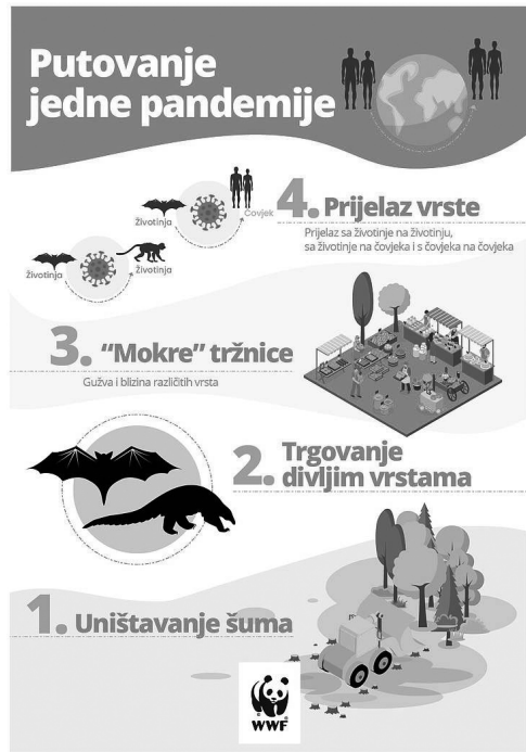
Slika 1. Putovanje pandemije – uzročnik: deforestacija