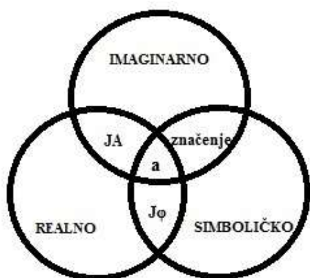
Slika 1. Boromejski čvor