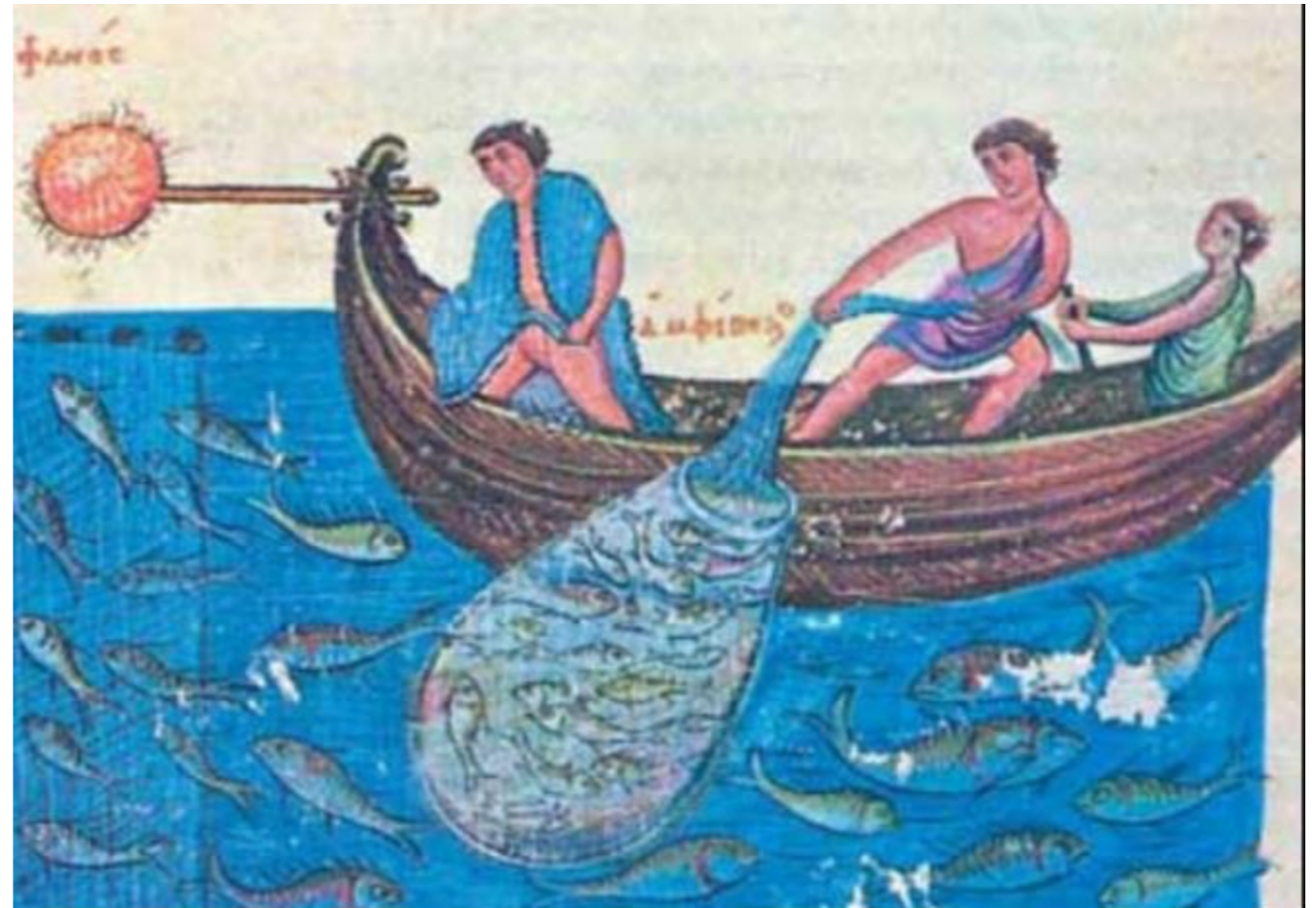
from: Venice, Biblioteca Nazionale Marciana, Codex Gr/Z 479=881,