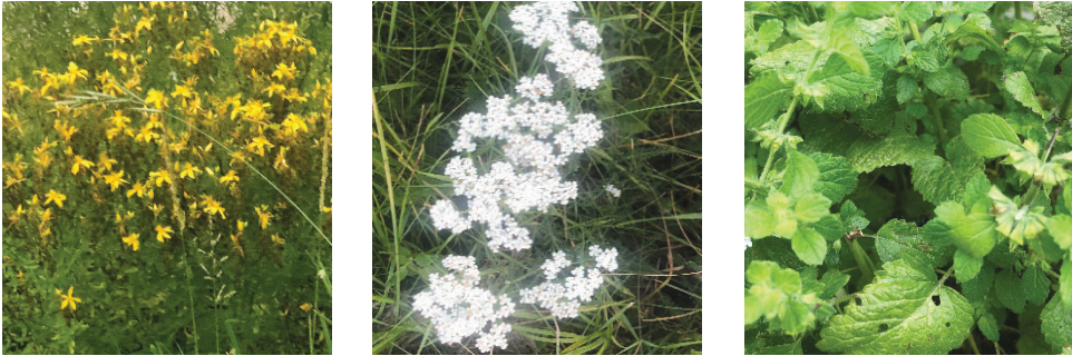
Slika 1. Buseni gospine trave ( Hypericum perforatum L.), stolisnika ( Achillea millefolium L.) i matičnjaka ( Melissa officinalis L.) na procjenjivanim pašnjacima