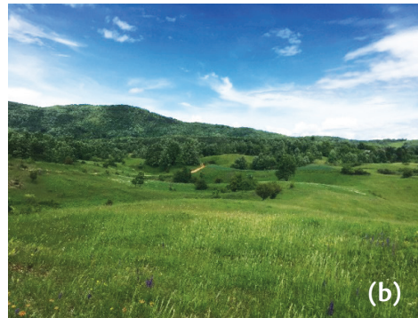
Slika 2. Procjenjivani pašnjaci pašnjaka u Kvarter, Lika (a) i u Velikoj Crkvini, Kordun (b)

Za dokumentiranje nalaza svojiti na pašnjacima u Kvarter i u Velikoj Crkvini digitalnim su fotoaparatom napravljene snimke prikupljenog herbarijskog primjerka biljke te panoramske snimke staništa i ploha (Slika 1.).