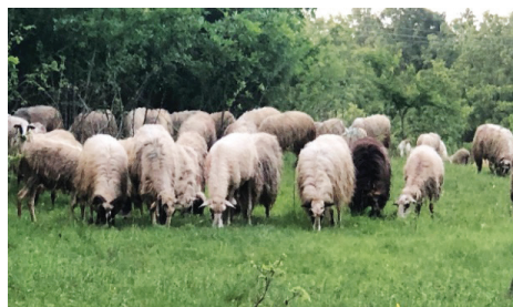
Slika 3. Stado ovaca pasmine lička pramenka na procjenjivanim pašnjacima

protočnu citometrijsku analizu. Krajem lipnja 2018. godine istim životinjama, u dobi od 3-5 godina također je izvađena krv za višebojnu protočnu citometrijsku analizu (Slika 3.). Ovo istraživanje dio je HRZZ projekta "Inovativni funkcionalni proizvodi od janječeg mesa" (IP-2016-06-3685) za koje je dobivena Odluka Etičkog povjerenstva u veterinarstvu (klasa 640-01/16-17/54; Ur. broj 25161-01/139-16-2) od strane Veterinarskog fakulteta Sveučilišta u Zagrebu i Rješenje od Ministarstva poljoprivrede R. Hrvatske, Uprave za veterinarstvo i sigurnost hrane Hrvatske (klasa: UP/I-322-01/17-01/31; Ur. br.: 525-10/052917-2).