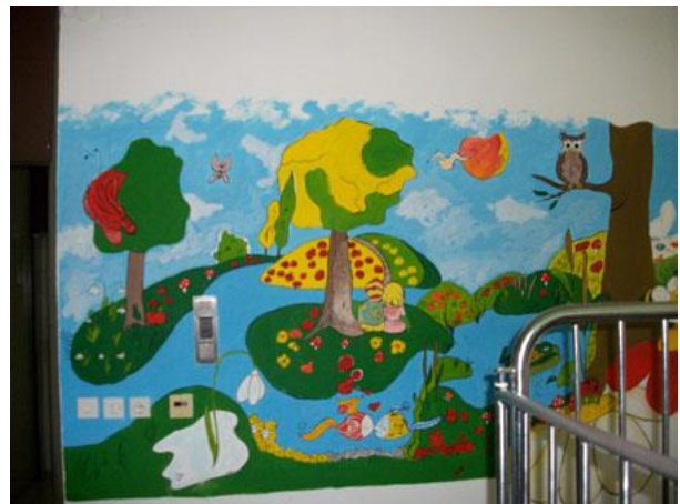
Slika 4: Odjel pedijatrije KBC Osijek