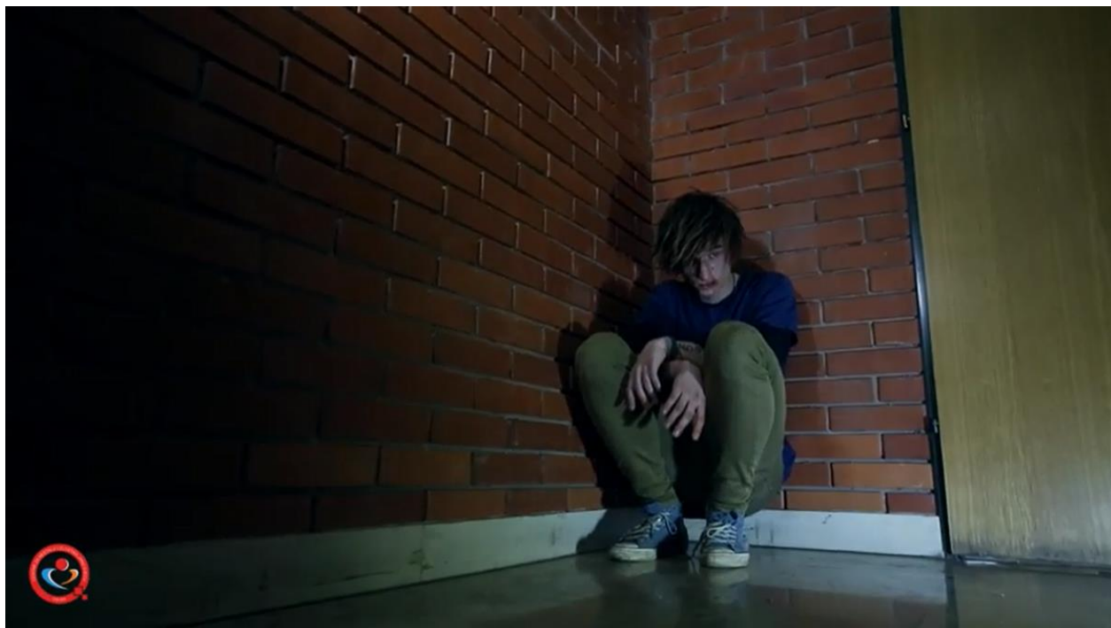
Slika 7: Promotivni spot CNZD povodom „Dana sigurnog interneta“, veljača 2014.(isječak)

Ovaj projekt, koji traje četvrtu godinu za redom, prošle je školske godine proširen i na medij videa. Učenici su sami osmislili nekoliko scenarija na temu prevencije internetskog nasilja, od kojih je odabran jedan i potom snimljen kao promotivni spot (Slika 8). Učenici su, kao i u slučaju oblikovanja plakata, sami glumili u spotu i sami su birali lokacije, uz podršku mentora, stručnog vodstva iz CNZD-a i profesionalnog snimatelja.