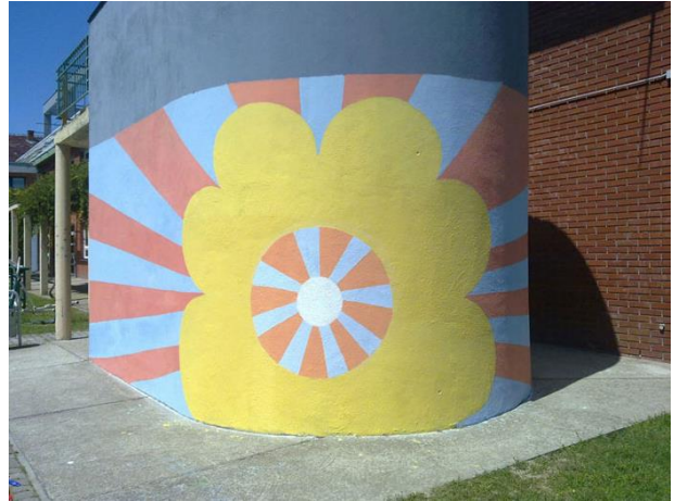
Slika 2: COO "Ivan Štark", Osijek