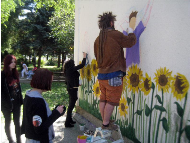
Slika 1: Dom za odgoj i obrazovanje djece i mladeži Osijek