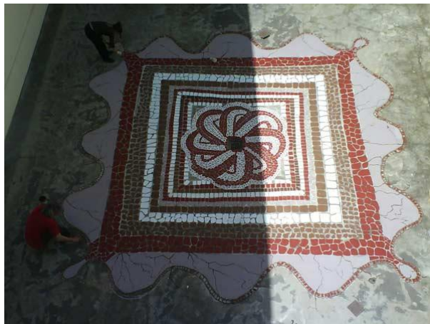
Slika 3: Osnovna škola Sv. Ane u Osijeku