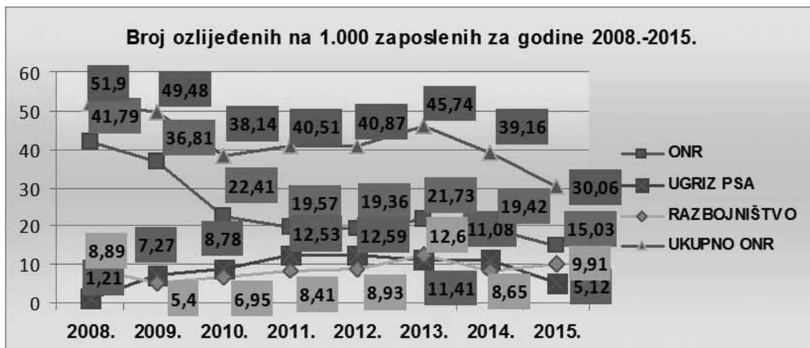
Slika 3. Disperzija stope ONR-a na 1.000 zaposlenih

Ova analiza razvidno prikazuje kako je najveća stopa ozljeda na radu bila prije promjene organizacijske strukture Pošte 2008. i 2009. godine (podsjećamo divizijski ustroj Pošte implementiran je tijekom 2009. godine), a organizacijska promjena vrlo pozitivno je djelovala na stopu ONR-a u 2010. godini. Potom je stopa ONR-a za naredne godine čak ponešto i rasla, što djelomičnim odljevom radnika, a više i zbog usklađivanja, strukturiranja, unificiranja i informatizacije procesa i aktivnosti svih poslova zaštite na radu u Pošti. Da su gornje aktivnosti uspješno okončane u 2013. godini pokazuje i kontinuirani – gotovo pravocrtni i veliki pad ukupne stope ONR-a u 2014. i 2015. godini, a koji se pad prema analizi ozljeda na radu iz 1. kvartala 2016. uspješno nastavlja. Zaista 3-4 godine (2010.-2013.) strukturiranja poslova zaštite na radu unutar sustava Pošte djeluje pretjerano. No, podsjetimo se na