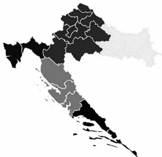
Slika 1. Grupe područja

Na karti Republike Hrvatske prikazane su grupe područja (slika 1).