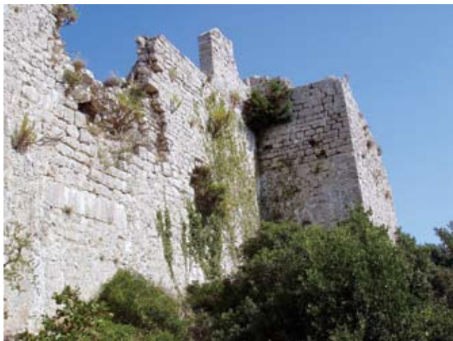
7. Stari ulaz na jugozapadu i južna kula

Old entrance in the south-western section and the south tower