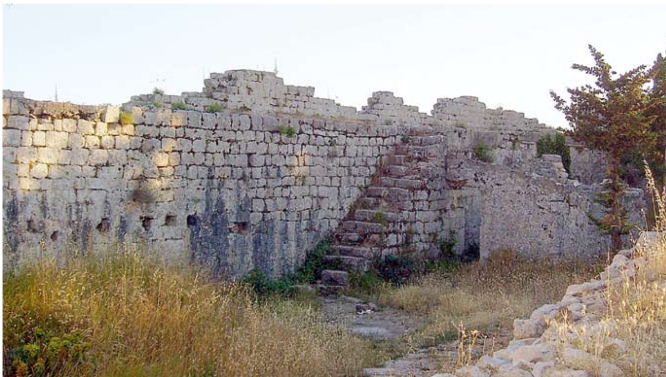
10. Unutrašnjost kaštela, jugoistočni potez zidina

glavnom je drvenom oltaru stajala uokvirena oltarna slika s likom Sv. Mihovila, zbog oštećenosti teško raspoznavljivim. Pod slikom se nalazila kamena oltarna ploča. Sa svake strane glavnog oltara otvarali su se ulazi u apsidu, s otvorom u obliku potkove. Crkva je bila osvijetljena s dva dugoljasta prozorčića oštra luka, na svakom zidu nedaleko oltara, a sličan se prozorčić nalazio nešto više u apsidi. 55 Izravnije svjedočanstvo o izgledu crkve pružaju spomenuti crteži F. Salghetti-Driolija i jedna fotografija. 56 Crkva je, kako je naglašeno ranije, bila presvođena, a sudeći prema nagibu krova, vjerojatno se radilo o gotičkom prelomljenom svodu. 57 Glavni i bočni portal te svi prozorčići imali su gotički prelomljeni luk. Detaljan crtež ulaznog portala pokazuje reljefno ukrašen nadvratnik i već spomenute grbove. I. Petricioli je identificirao desni grb s onim opata Petra, koji je na toj dužnosti u samostanu Sv. Mihovila bio od 1340. do 1364. godine, a lijevi s grbom zadarskog nadbiskupa Nikole Matafara (1333.-1367.), i time datirao gradnju crkve u sredinu 14. stoljeća. 58 Crkva je - svojom jednostavnom arhitekturom s naznakama gotičkog stila - odgovarala tipu ruralnih gotičkih crkava kakve se nalaze na zadarskom području. 59 No, s obzirom da se u sklopu samostana, koji je postojao od 12. stoljeća, morala nalaziti starija crkva, treba ostaviti