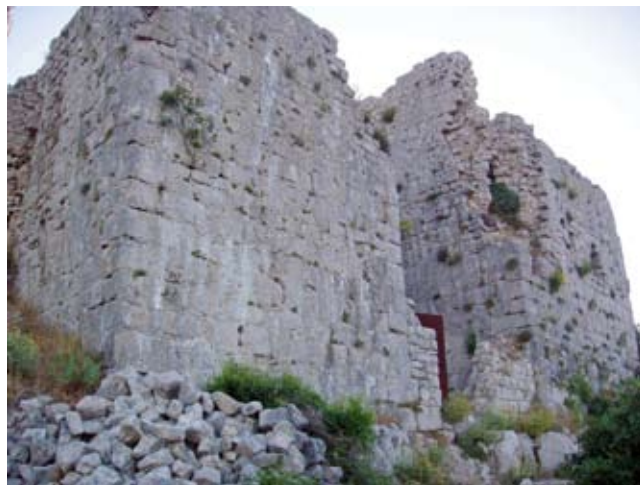
5. Donjon i ulazna kula