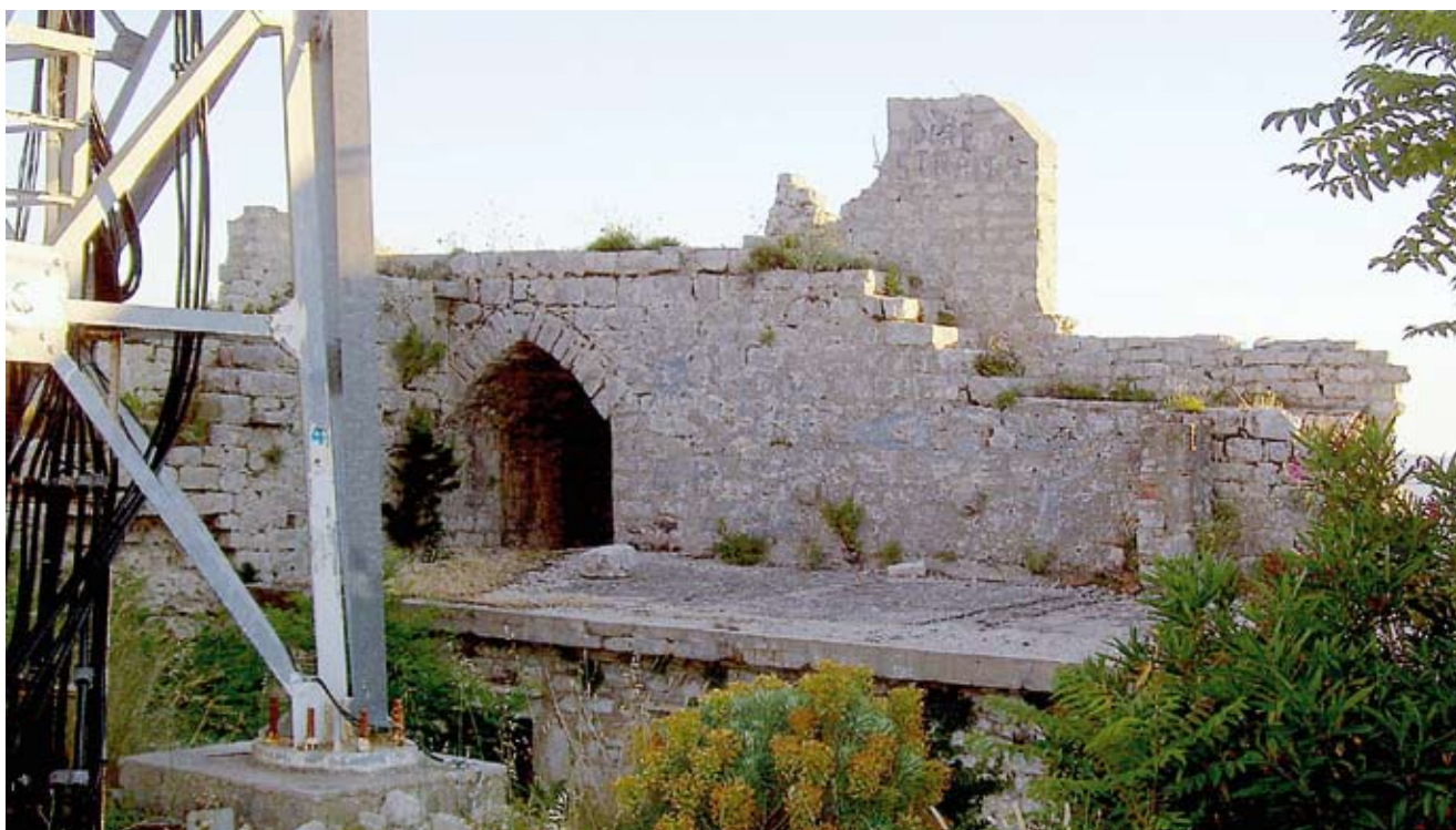
8. Južni potez zidina s otvorom južne kule

20. stoljeća (sl. 2), te na crtežima F. Salghetti-Driolija iz 19. stoljeća (sl. 3). 48 Postoje tri ulaza u kaštel, dva izvorna su zazidana, a onaj novijeg datuma probijen je u sjeveroistočnom zidu. Glavni ulaz nalazio se s jugozapadne strane kaštela, koja je okrenuta moru i gdje se nalazi mala zaravan, dovoljna za pristup vratima. Vjerojatno je zbog lakog prilaza vratima taj ulaz ubrzo nakon gradnje bio zazidan. Sastoji se od pravokutnog otvora s masivnim nadvratnikom. Drugi, manji ulaz nalazi se na suprotnoj strani utvrde okrenutoj Zadru. Smješten je između velike kule ( donjona ) i produžetka obrambenog zida koji tvori mali propugnakul (sl. 4). Do njega vodi usko strmo stubište djelomično usječeno u živu stijenu. Oblik ulaza odgovara tipičnom romaničkom portalu s lunetom. Dovratnici su sastavljeni od više kamenih blokova od kojih se pojedini horizontalno uvlače u zidnu masu, a na njima leži masivan nadvratnik. Luneta je ispunjena zidnom masom i uokvirena glatkim klesanim okvirom. Glavna kula utvrde nalazi se sjeverno od spomenutih vrata, skoro je kvadratnog tlocrta, širine 8,5 i dužine oko 7 metara. Prema opisu L. Benevenije, krajem 19. stoljeća unutrašnja raspodjela na katove više nije postojala, ali vidjele su se rupe za grede podova, a još uvijek je stajao i svod na vrhu kule. Nad svodom se nalazila terasa s jednom do dvije kamene klupe. Pod