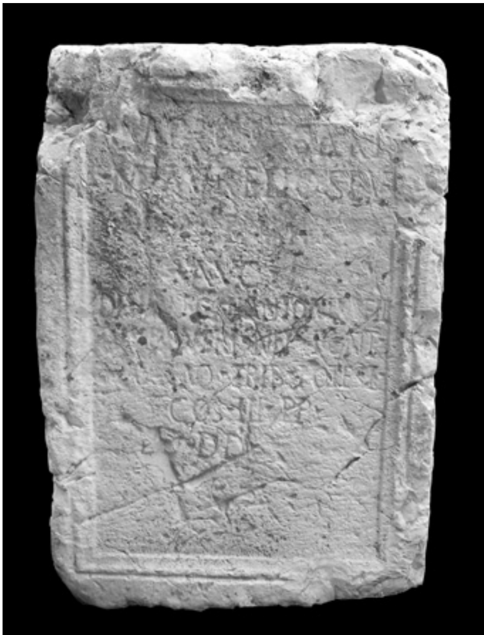
Sl. 3. CIL III, 3121 (10118) – natpis na bazi kipa cara Aleksandra Severa (Rab, lapidarij muzejske zbirke)