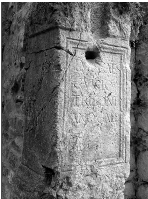
Sl. 4. CIL III, 3122 (10119) – natpis na bazi kipa cara Trebonijana Gala (Rab, kula Gagliardi)