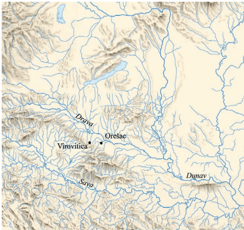
Karta 1. Položaj Orešca u odnosu na Viroviticu (autorica: Kristina Jelinčić).

metara sjeveroistočno od grada Virovitice (karta 1). Nalazi se na lesnoj terasi koja se spušta od Bilogore prema Dravi. U selu i na njegovim rubovima postoji više mikrolokacija koje su registrirane kao različiti lokaliteti na kojima su ljudi boravili u različitim razdobljima. U ovome će radu biti riječi o položaju Svetinja koji se nalazi sjeverno od zadnjih kuća na istočnome dijelu sela, a njegov je sjeverni rub određen koritom rijeke Brežnice. Točnije, riječ je o dijelu lokaliteta koji graniči s lokalitetom Bašće smještenim zapadno od Svetinje, također sjeverno od kuća, a južno od korita rijeke Brežnice. Sa svoje istočne strane Svetinja graniči s lokalitetom Dvorina. Na lokalitetu Svetinja nalazi se antička nekropola koja je dosta uništena današnjim grobljem i vađenjem pijeska, a kako su pokazala novija istraživanja, ondje se nalazio i stambeni dio Orešca (Jelinčić 2007; 2008; 2008a). Istočno od Dvorine nalazi se položaj Luka, smješten južno od Brežnice. 1