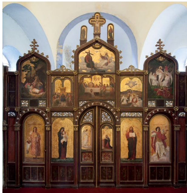
Sl. 3. Ikonostas pravoslavne kapele donjogradske gimnazije u Zagrebu, danas u crkvi u Bolfanu kod Ludbrega, 1912.

Izgradnja ovoga velikog kompleksa, podignutoga prema projektu arhitektonskog biroa iz Leipziga Ludwig & Hülssner može se na prvom mjestu zahvaliti najglednijem predstojniku Odjela za bogoštov-