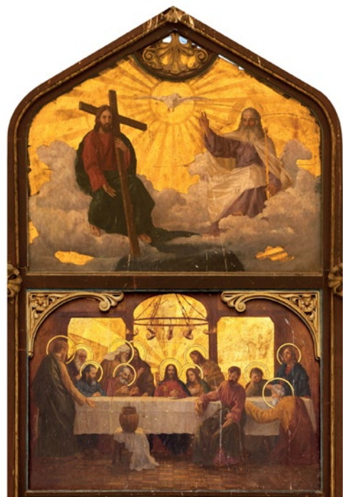
Sl. 6. Ivan Tišov, Posljednja (Tajna) večera i Sveta Trojica , ikone s ikonostasa pravoslavne kapele donjogradске gimnazije u Zagrebu, danas u crkvi u Bolfanu kod Ludbrega, 1912.

školu za pravoslavnu crkvu. Kako se nalazi u prilično zapuštenom stanju, mnoge su ikone crvotočne, a nesumnjivo stradavaju i zbog već spomenute vlažnosti crkve koja dijelom prokišnjava, trebalo bi što skorije pristupiti konzervatorsko-restauratorskim zahvatima. 37