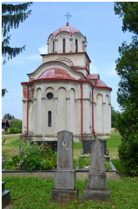
Sl. 2. Crkva Svete Petke/Paraskeve u Bolfanu kod Ludbrega, apsida fotografirana s mjesnog groblja

Bolfanska parohija nekada je bila prostrana i s relativno velikim brojem vjernika. Obuhvaćala je sela Čukovac/Čukovec/Čukovac (u kojemu se i danas nalazi spomenuta dijelom drvena pravoslavna crkva), Torčec, Segovinu, Belanovo Selo, Ivančec te pravoslavne vjernike Ludbrega. Pred Drugi svjetski rat brojala je gotovo 900 vjernika pa ne čudi odluka o izgradnji novoga hrama. 5 Njegova izgradnja može se vezati uz graditeljsku aktivnost prvog mitropolita Eparhije zagrebačke, utemeljene 1932. godine (unutar koje se Bolfan i danas nalazi), Dositeja Vasića (Beograd, 1878. – 1945., mitropolit zagrebački 1932. – 1941./1945.). Mitropolit Dositej potaknuo je, naime, izgradnju cijeloga niza novih pravoslavnih hramova, ponajprije na zapadnom rubu svoje eparhije. Najveće je podigao u slovenskim gradovima Celju, Mariboru i Ljubljani, 6 a manje crkve dao je