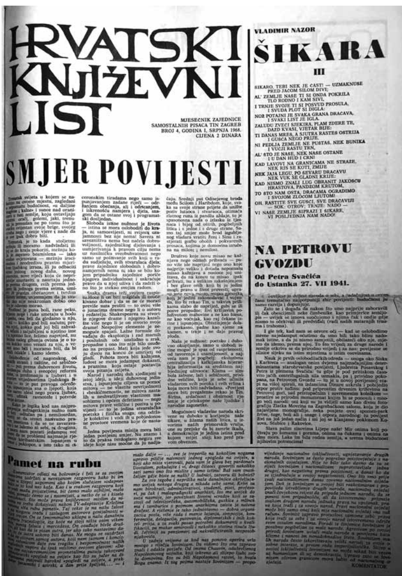
Naslovna 4. broja Hrvatskog književnoga lista

Zato su nastajale te ponekad, rijetko, upravo iznimno i nestajale – stranke. Nestajale su jednako kao i danas: onda kad su zastupale prizemne, privatne, nepolitičke interese, a ne načela i programe, jer – što u Pismima Magjarolacah reče Ante Starčević – „medju načeli bo neima nagodbe ni pomirenja, a stranke su zastupnici načelah. Ako stranka gubi boj za bojem, ona itako neodlazi s razboja, nego na njemu predaje zastavu svojim sinovom, unukom, budućim pokolenjem svojim.“