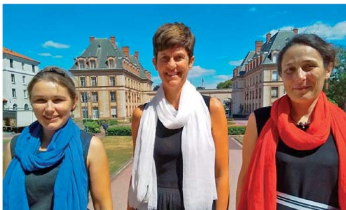
Slika 5. ► Francuske mentorice: hodajuća zastava.

Tijekom Olimpijade učenici i mentori posjetili su važne institucije kao što su Palača otkrića ( Palais de la découverte ), Politehnička škola ( École Polytechnique ) i grad znanosti i industrije ( Cité des sciences et de l'industrie ) te čuvene muzeje Louvre i Versailles. Časopis Catalyzer pratio je u riječi i slici najvažnija zbivanja na Olimpijadi te podsjećao koliko je ogroman doprinos Francuza u kemiji. Tako smo doznali da je jod otkrio francuski kemičar i farmaceut Bernard Courtois, fluor Henri Moissan, radij francusko-poljski bračni par Pierre i Marie Curie te francij Marguerite Perey (prva žena primljena u francusku akademiju znanosti, studentica Marie Curie), a za Karplusovu jednadžbu, bitnu u NMR spektroskopiji, zaslužan je Martin Karplus, dobitnik Nobelove nagrade za kemiju 2013. godine. S njegovim znanstvenim postignućem bili su povezani zadaci 1 i 8 u teorijskom dijelu ispita. Zadatak 6 bio je posvećen kemiji polimera i još jednom francuskom nobelovcu Pierre-Gilles de Gennes (kojeg popularno nazivaju »Isaac Newton naših dana«, dobitnik Nobelove nagrade za fiziku 1991.), zadaci